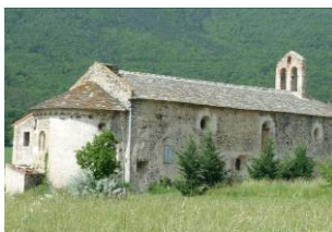
La chapelle photo Jane

L'avancée est régulière ( 24 km/h ) jusqu'à la montée de Bouleternère où Serge s'excite sans raison. Il se fait aussitôt tancer vertement par plusieurs des ses coéquipiers.