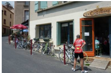
La sieste des vélos