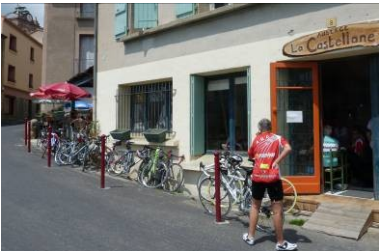
La sieste des vélos