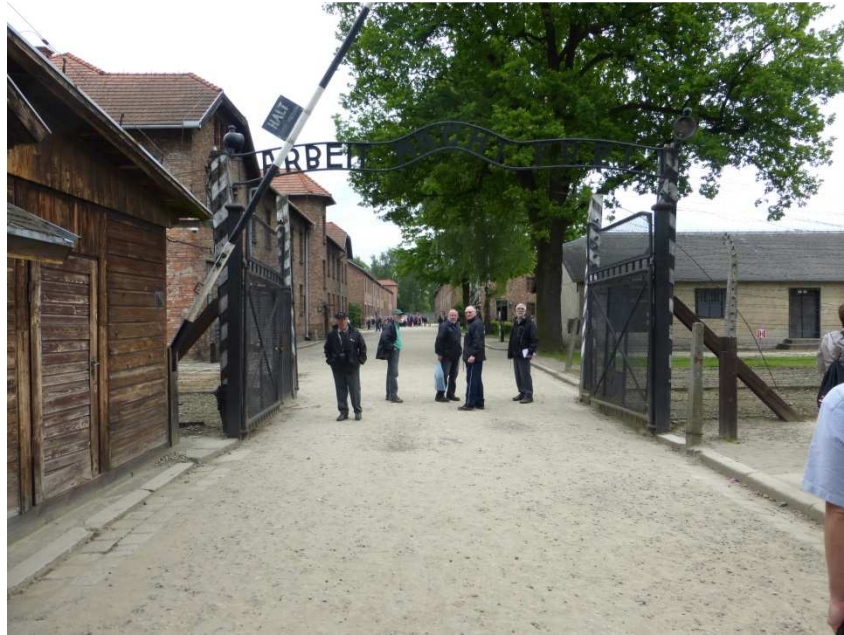
ARBEIT MACHT FREI (Le travail rend libre)

Dès notre entrée dans le camp, en connaissant le passé de ce camp, une angoisse nous étreint et les inscriptions cyniques, situées au-dessus du portail nous laissent dubitatif.