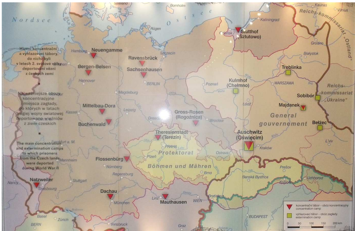
Emplacement géographique des camps implantés par le 3 ème REICH : de concentration (triangles rouges), d'extermination (carrés verts).

Dans le bloc n° 18, est implanté, un musée dédié aux déportés de France. C'est dans ce bâtiment que nous pouvons lire ce texte appelant à la réflexion :