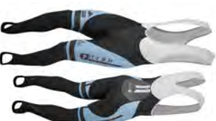
Cuissard longue CLL410