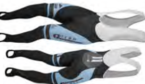
Cuissard longue CLL416