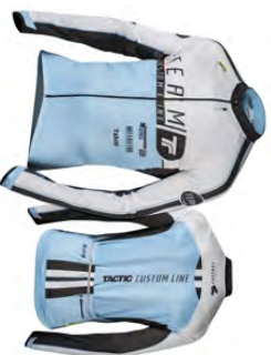
Maillot manches longues MLL125