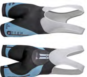
Cuissard court CC216