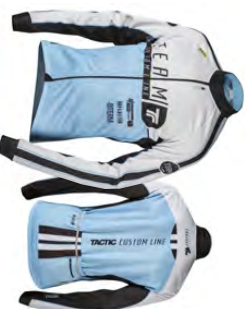
Veste thermique JQM140