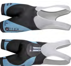
Cuissard court CC210