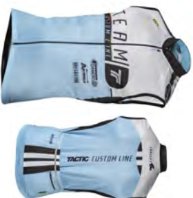
Maillot sans manches MSM170/ 171