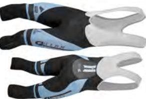
Cuissard corsaire été | hiver CP317