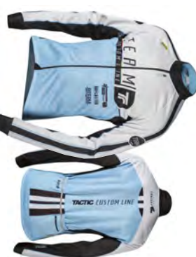
Veste thermique | membrane totale JQM140/ 141