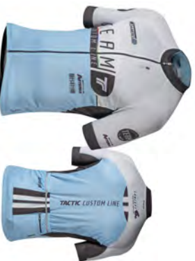
Maillot manches courtes MC100/ 101/ 150/ 151