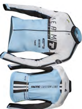
Maillot manches longues MLL125/ 175