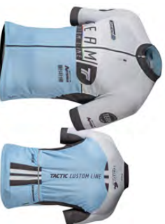
Maillot manches courtes MC101